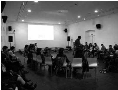
Fig. derecha: Sesión de expertos: Nerea Campillo-Arquitecto In the Air Uriel Figué-Arquitecto UHF Ariadna Cantis-Arquitecto Fres Madrid