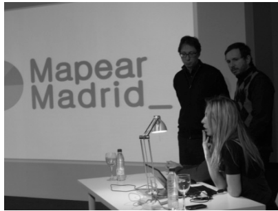
Fig. derecha: Profesionales asistentes al acto

Fig. izquierda: Publicación de la plataforma digital en CA2M