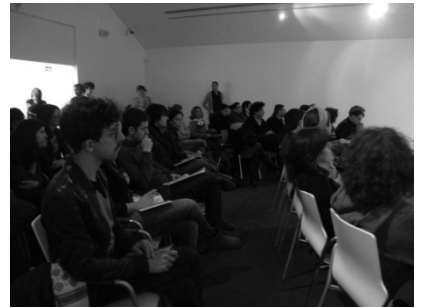
Fig. izquierda: Punto de conexión en CA2M

Fig. derecha: Profesionales asistentes al acto