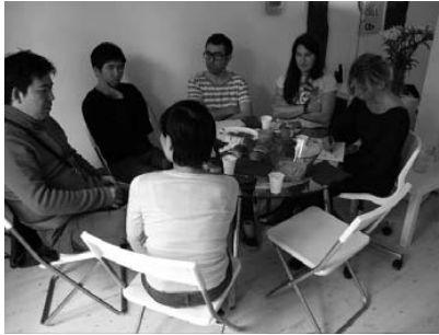
Fig. derecha: Sesión de trabajo en CA2M

Fig. izquierda: Reunión de programadores