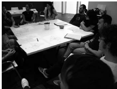
Fig. derecha: Presentación de resultados