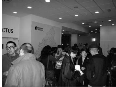
Fig. derecha: Sesión de trabajo en CA2M