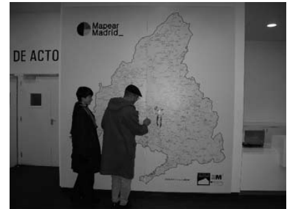
Fig. izquierda: Sesión abierta en CA2M