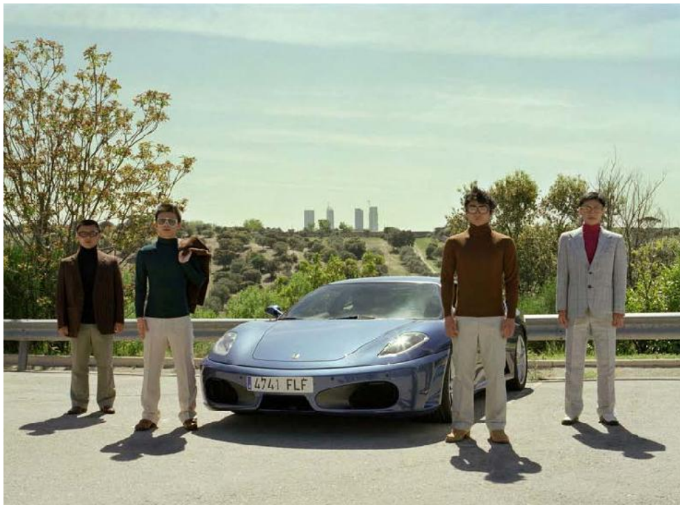
Boys&Cars , 2007-2009. 18 fotografía. Dimensiones variables

La base de la que partir es la idea del éxito alcanzado mediante la posesión de ciertos bienes de consumo, en este caso es el vehículo de lujo que pretende aludir directamente a una imagen estereotipada del nuevo hombre rico y moderno. En la serie videográfica, los personajes anónimos aparecen como reflejo de un idealismo social en el que la realidad se disfraza y se ve similar a un sueño, el sueño capitalista. Filmados en la ciudad de Pekín, Caracas y El Cairo, tres personajes diferentes son entrevistados en escenarios concretos, respondiendo preguntas rescatadas de internet al filósofo alemán Peter Sloterdijk y mostrando su particular visión del mundo.