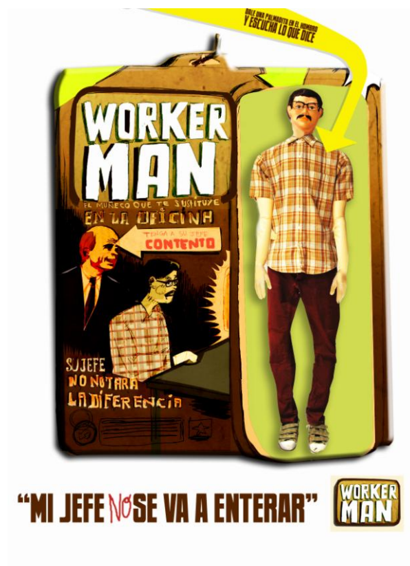
Worker Man , 2009. 4 dibujos de 30x30 cm cada uno; Packaging con muñeco de 200 x 150 cm, con sistema de sonido para decir frases; atrezzo vario del montaje, cartel

Es fácilmente customizable, y con unos pequeños retoques, puedes hacer que se parezca a ti. En breve podrás disfrutar de la versión femenina ( worker woman ) y la versión infantil ( worker kid ) especialmente indicada para que los niños puedan hacer peyas en el colegio sin que el profe se entere.