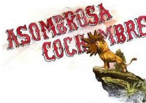
Asombrosa Cochambre , 2009. Instalación mural. Dimensiones variables