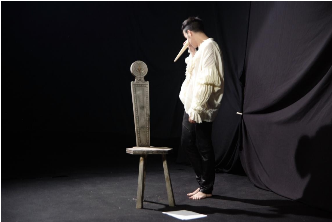
Lie , 2009. Video monocal, sonido

LIE es un retrato a color, con tratamiento pictórico y estilismo teatral sobre fondo negro en el que una voz en off va narrando la "mentira" en inglés con subtítulos en castellano. En realidad LIE es un Audio, ya que la importancia del texto es capital.