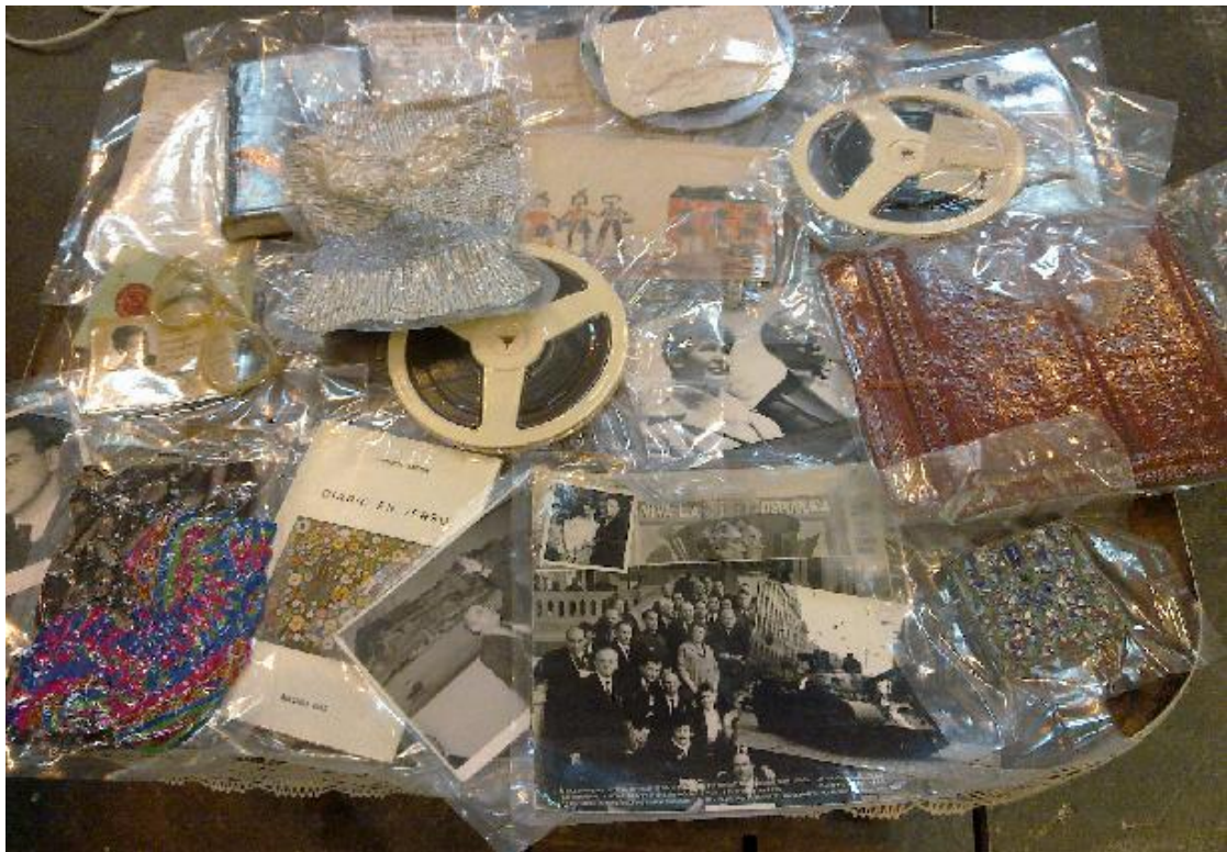
Memoria al vacío , 2009. Instalación de 2 canales de vídeo y objetos envasados al vacío. Dimensiones variables