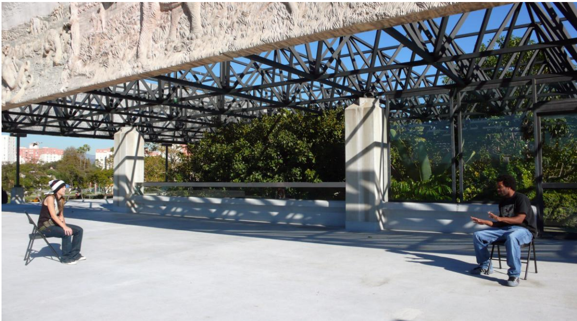
The Couple , 2008. Instalación audiovisual de 2 canales de vídeo

The Couple quiere mostrar al espectador el problema de la distancia o en contraposición cercanía, de la construcción conjunta o la rivalidad, del dúo o el individualismo que es característico en la pareja de nuestra actual época. La "guerra de sexos".