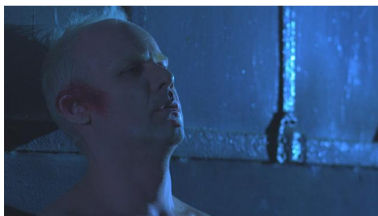
Nexus , 2009. Vídeo en tri-proyección. 8'07"