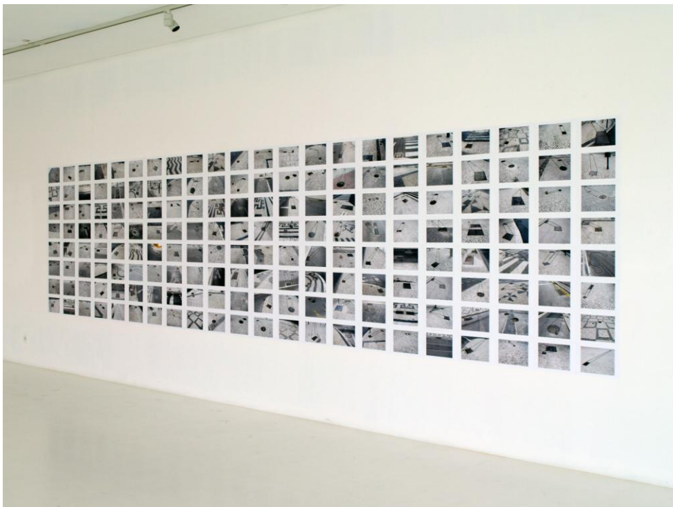
Metaesquemas , 2009. Tinta china sobre impresión ink-jet. 21 x 30 cm (cada dibujo)

"Y fueron felices y comieron perdices" es una secuencia fotográfica en la que la artista mediante autorretratos representa la personificación de ese individuo, que intenta encontrar la estabilidad carente en su existencia creando un onanismo sentimental. Hacia el espectador es como lanzar una pregunta al aire, de hacer explícita la existencia de esa tendencia de comportamiento y meditar sobre: ¿es eso amor, es eso estabilidad?, ¿Desde dónde vivimos las relaciones interindividuales? ¿Es negativo y antinatural a nivel social? O ¿podría ser que se convirtiera en una nueva forma de ver las relaciones afectivas, manteniendo el romanticismo de los cánones tradicionales del amor ya obsoleto, pero desde un contexto artificial? Una distopía emocional sobre el amor y la felicidad igualmente turbadora.