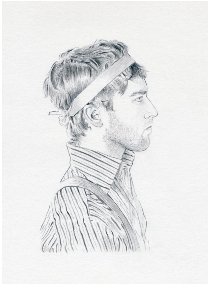
Philomythés / Mitomani , 2008. Instalación: 16 dibujos, 14 x 19 cm, enmarcados en 30 x 40 cm. Lápiz sobre papel

El proyecto está formado por dibujos a grafito que toman como modelo fotografías y frases de presentación de los "perfiles" de Myspace, recomponiendo desde una mirada trans-histórica las imágenes con las que los usuarios se autorepresentan, exteriorizan y "mitifican".