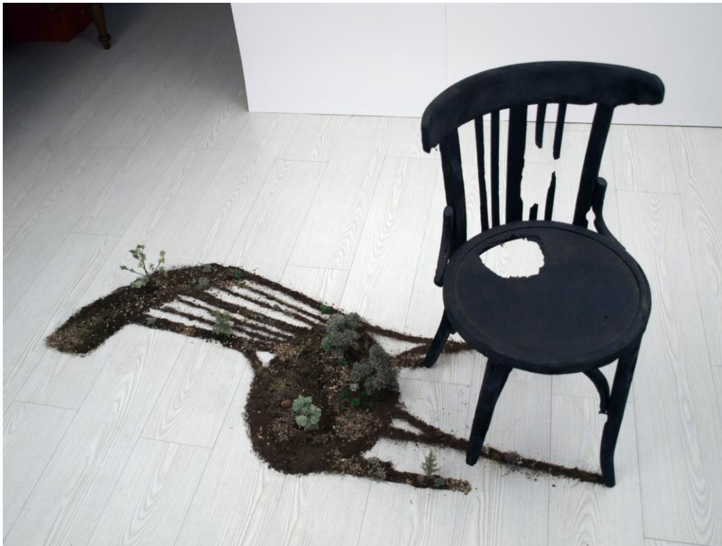
Silla Modelo Tietar , 2009. Instalación: silla rescatada de la basura, restaurada y quemada, tierra, piedras, ramitas y líquenes. Medidas variables

El resto de materiales son líquenes, tierras, ramas y piedras de pinares castellanos y bosques gallegos, que han pasado por un riguroso proceso de selección.