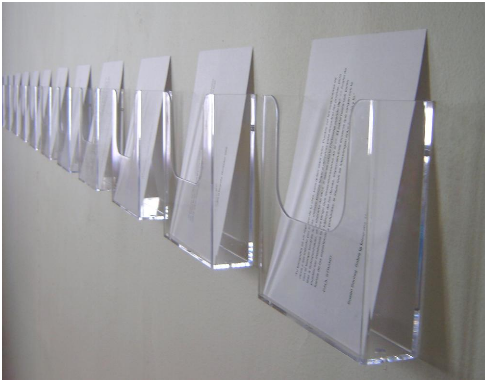
Alimento Discursivo Teórico , 2008-2009. Instalación sobre pared: 13 porta

Ofrezco algunos apuntes de mi Alimento Discursivo Teórico a disposición de quien quiera servirse.