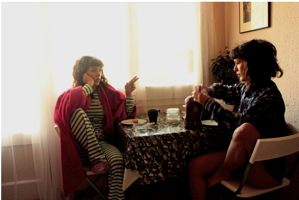
Y fueron felices y comieron perdices , 2009. Serie de 7. Fotografía digital. Copia baritada sobre dibond y bastidor de aluminio, 20 x 31 cm (cada una)

Y fueron felices y comieron perdices es una secuencia fotográfica en la que la artista mediante autorretratos representa la personificación de ese individuo, que intenta encontrar la estabilidad carente en su existencia creando un onanismo sentimental. Hacia el espectador es como lanzar una pregunta al aire, de hacer explícita la existencia de esa tendencia de comportamiento y meditar sobre: ¿es eso amor, es eso estabilidad?, ¿desde dónde vivimos las relaciones interindividuales? ¿es negativo y antinatural a nivel social? o ¿podría ser que se convirtiera en una nueva forma de ver las relaciones afectivas, manteniendo el romanticismo de los cánones tradicionales del amor ya obsoleto, pero desde un contexto artificial? Una distopía emocional sobre el amor y la felicidad igualmente turbadora.