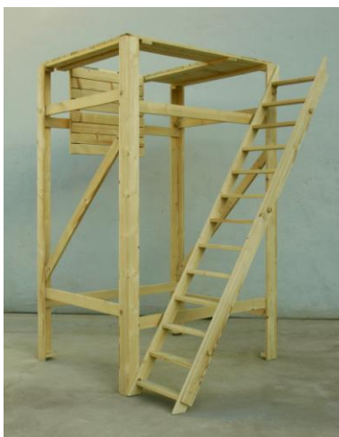
Nöjespark (2 piezas): Schavott , 2009. Madera. Dibujo y collage: 30 x 40 cm; Nöjespark , 2009. Madera y alambrada. Dibujo y collage sobre papel, encolado sobre madera: 98,5 x 150 cm.