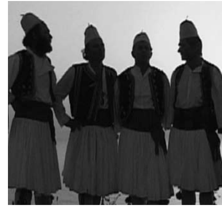
1 - FLUID VIDEO CREW, LINEA D'OMBRA , 6', 2004, IT

publicidad, el videoclip y el videoarte. A su vez, el vídeo, gracias a los contenidos y a la narración clásica, se alimenta del cine. Esto permite reducir costos y lo más importante: experimentar con la luz, los encuadres, la fotografía en general y el montaje. Los cineastas tienen la posibilidad de experimentar a nivel estético con resultados a veces notables, conseguir una nueva identidad que hasta ahora había sido limitada. La vocación realista del cine, desde todo punto de vista, ha dado paso a la investigación estética creando nuevos lenguajes. Los videoartistas, que en el pasado experimentaban exclusivamente en vídeo y su disfrute era únicamente en este formato (todos los exponentes del videoarte en Italia), ahora tienen la posibilidad real de producir una película narrativa en formato digital para ser vista en las salas de cine.