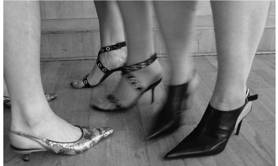
1-HIGH HEEL SISTERS. SHOE PIECE , 2 MIN, 2002, ESCANDINAVIA