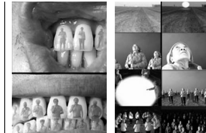
1 - WANG GONGXIN, KALA OK , VIDEO, 2000 2 - WANG GONGXIN, MY SUN , VIDEO, 2001

Video art, by its very nature, has advantages over other media in China. Firstly, it is a new media its own set of languages and discourses, both visual and theoretical. These novelties have enhanced chances for funding. Additionally,