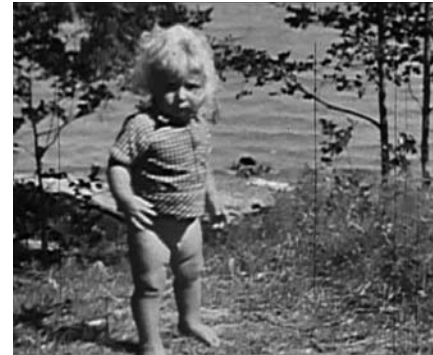
2- SEPPO RENVALL. WOODY , 2003, 5:20 MIN, FINLANDIA 3- THE ICELANDIC LOVE CORPORATION. THANK YOU , 2002, 3 MIN, ISLANDIA

In collaboration with the project of distributing Hit the North, I entered into contact with the majority of the channels where Nordic video-art is represented. I obtained a lot of help from all the people I asked and I am sure that it is because on that occasion there was a budget that enabled me to travel to all the countries and in situ gain trust in the project. It is clear that the distributors dedicated to video-art and experimental film are alternative themselves and have a more open attitude towards the diffusion. The big clash nowadays, is in the galleries with commercial interests who want to have exclusivity over an artist's video piece to be able to sell quite a few copies, at exorbitant prices, with the risk that later they never exhibit in public, unless in the so called situations of recognition (read important art galleries, festivals with status, etc.). In Filmform we try to influence this, to indicate that an artist can be benefited enormously by having